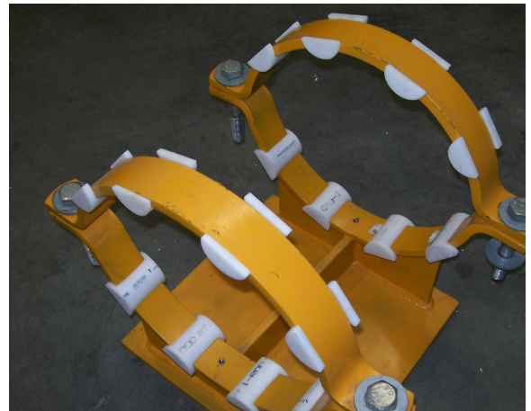
Instalación de I-Clip estándar para una abrazadera de tubería Grinnell.