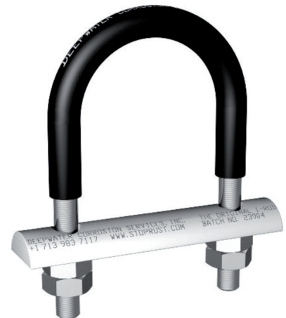
Un conjunto Nu-Bolt estándar para soporte de tubería.