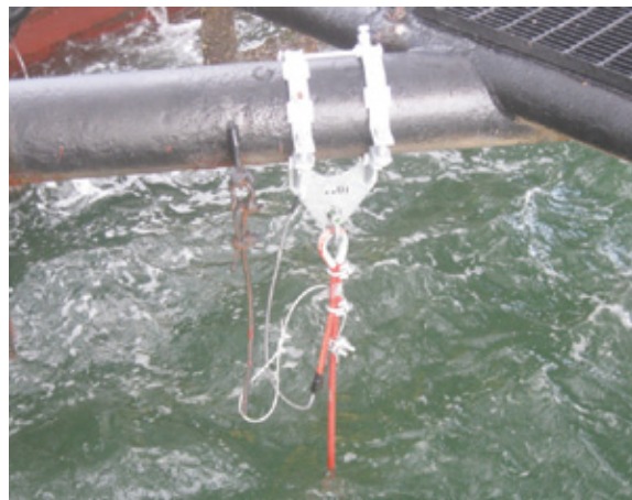
Saliente fija con abrazadera

El RetroLink es un sistema reemplazable y durable de cinco años que se instala en una hora y media.