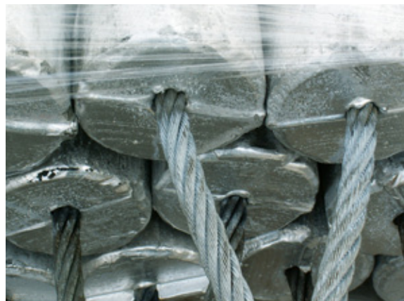
Ánodos de sacrificio

RetroLink instalado con una saliente con abrazadera