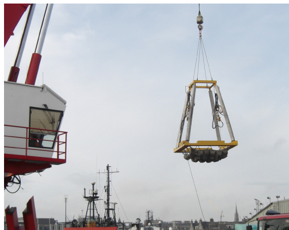
Mar do Norte

ROVs colocam um coxim em águas profundas e instalam RetroClamps.