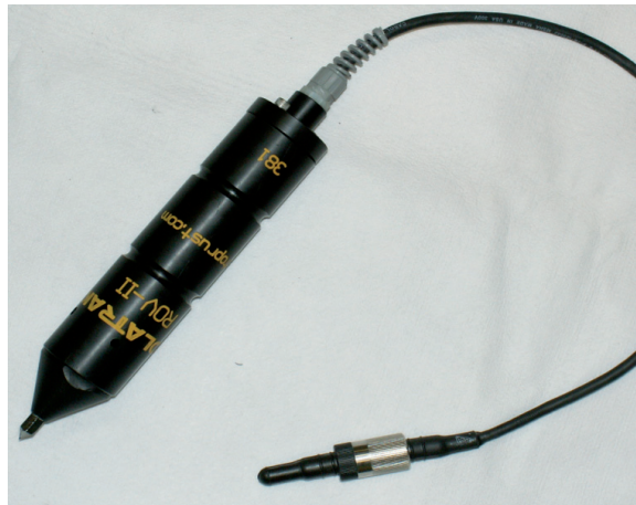
ROV-II mais conector

Uma foto submarina de uma medição de proteção catódica padrão (o manipulador T não está sendo usado).