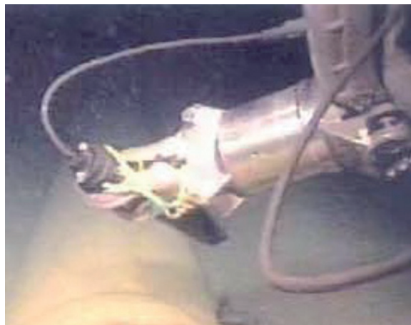
Proteção catódica padrão

A sonda ROV II é mostrada no suporte do manipulador T compatível.